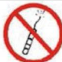
MATERIAL EXPLOSIVO EXPLOSIVE MATERIAL