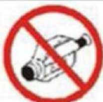
CÂMERAS DE FILMAR VIDEO CAMERAS