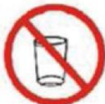
COPOS DE VIDRO GLASSES