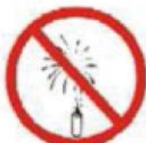
MATERIAL PIROTÉCNICO FIREWORKS