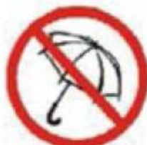
CHAPÉU DE CHUVA UMBRELLAS