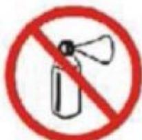
PISTINAS DE AR COMPRIMIDO AIR HORNS