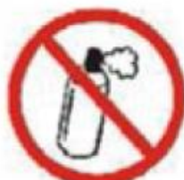
LATAS DE GÁS GAS CANISTERS