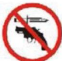
FACAS E ARMAS KNIVES AND ARMS