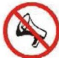
ALTIMAFI ANTIFA LOUDSPEAKERS